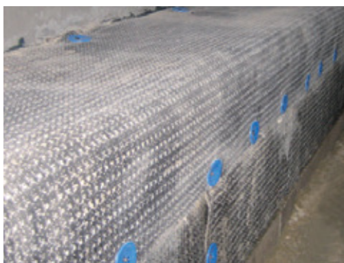
Detail vzájomného napojenia dvoch bentonitových pásov Mapeproof