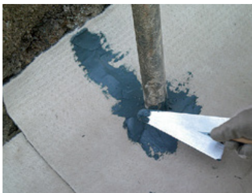
Aplikácia Mapeproof Mastic stierkou okolo potrubia