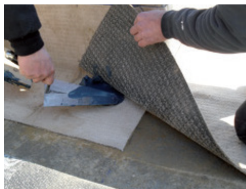
Utesnenie miesta presahu dvoch bentonitových pásov Mapeproof s použitím Mapeproof Mastic