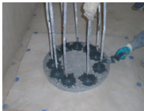
Aplikácia Mapeproof Mastic stierkou okolo ocelevej výstuže