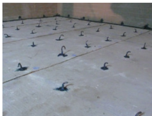
vytesnenie napájacej výstuže s Mapeproof Mastic