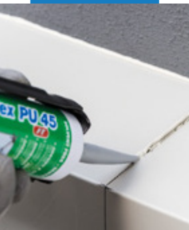
Pružné tesnenie konštrukčných škár

pre chodcov“) s vlastnosťami PW-EXT-INT-CC.