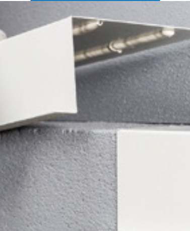
Pružné lepenie konštrukčných prvkov