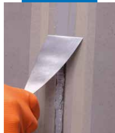
Vyhľadanie povrchu Mapeflex PU40