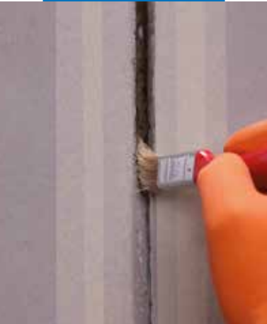
Aplikácia Primer M

Mapectex PU40 je škodlivý, pri vdýchnutí môže vyvolať alergické reakcie u ľudí citlivých na izokyanáty. Dráždi oči. Pri práci sa odporúča používať ochranné rukavice a okuliare a dodržiavať bežné opatrenia ako pri manipulácii s chemickými výrobkami. Pri kontakte výrobku s očami alebo pokožkou, vypláchnite postihnuté miesto veľkým množstvom vody a vyhľadajte lekársku pomoc.