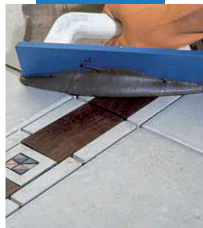
Škárovanie keramickej dlažby s drevenými dekormi pomocou stierky