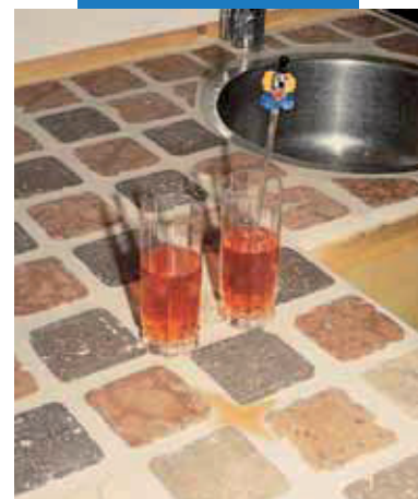
Príklad nalepeného a vyškárovaného kuchynského pracovného stola