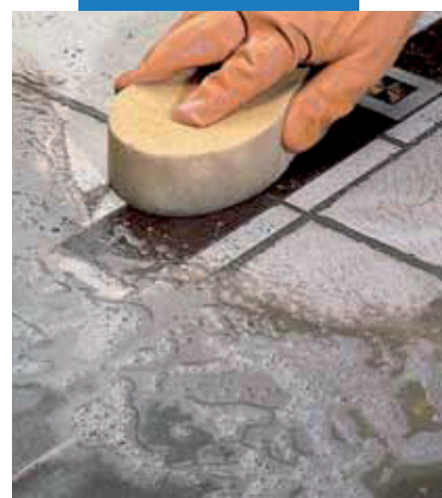
Leštenie keramickej podlahy s drevenými dekormi pomocou špongie