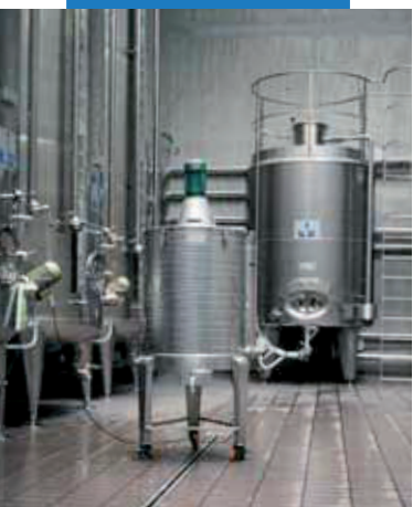
Príklad vyškárovej podlahy vinnej pivnice