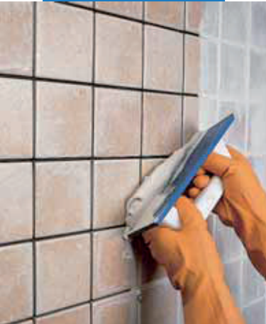
Škárovanie pomocou gumenej stierky