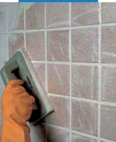
Dokončenie škár pomocou stierky Scotch-Brite®