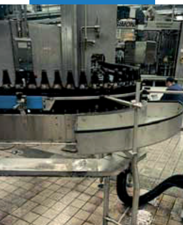
Príklad vyškárovej podlahy v pivovare