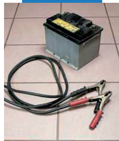
Príklad vyškárovanej akumulátorovne

Pri dokončovaní rozsiahlych plôch použite výkonné rotačné diskové hladidlá s čistiacimi nástavcami Scotch-Brite® dobre nasýtenými vodou. Všetka prebytočná tekutina sa môže odstrániť z povrchu pomocou gumenej stierky. V prípade, že od zaškárovania s Kerapoxy uplynula príliš dlhá doba a malta už začala tuhnúť, pridajte 10% alkoholu do čistiacej vody.