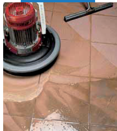
Vyhľadovanie porcelánovej dlažby pomocou výkonnej jednototúčovej leštičky, alebo gumovej stierky