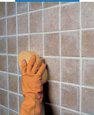
Dokončenie škár pomocou špongie