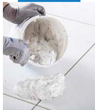
Krémová konzistencia správne namiešanej malty

Pri čistení rozsiahlych podlahových plôch povrch navlhčíte a použijete výkonné rotačné zariadenie so špeciálnymi abrazívnymi diskami podobnými ako Scotch-Brite®. Nadmerné