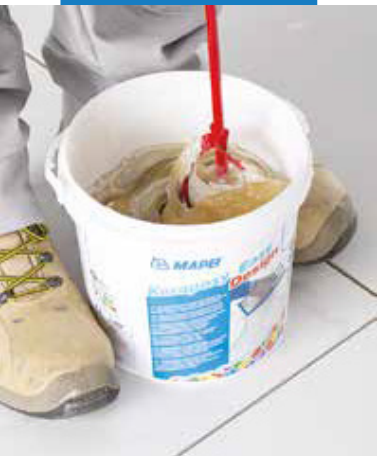
Miešanie zložiek (A+B)

metalizujúceho efektu, ktorý sa dodáva vo vopred navážených vreciach po 90 gramov, čo zodpovedá 3 % (hmotnostne) z 3 kg balenia Kerapoxy Easy Design. Mapecolor Metallic je dostupný vo farebných odtieňoch Moonlight (podobné ako Planinum), Sahara (podobné k zlatej), Shining (podobné k striebornej), Red Clay (podobné k medenej) a Stardust (podobné k tmavo striebornej). Za účelom získania homogénnej zmesi sa odporúča pridať Mapecolor Metallic zelenej farby do Kerapoxy Easy Design 700 (priesvitná). Zmiešaním Mapecolor Metallic s Kerapoxy Easy Design je možné získať široké spektrum metalizujúcich efektov s rozdielnou intenzitou a tieňmi. V každom prípade sa odporúča vždy najskôr vykonať skúšobný test, pretože výsledný odtieň je výrazne ovplyvnený vybranou farbou a aplikovaným množstvom. V každom prípade sa pridáva do zmesi max. 3% (hmotnostne) tak, aby neprišlo k zmene spracovateľnosti malty.