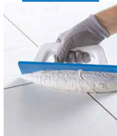
Aplikácia Kerapoxy Easy Design s gumovou stierkou MAPEI