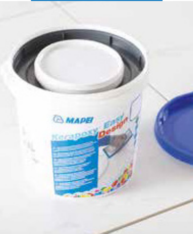
Kerapoxy Easy Design sa dodáva vo vedre obsahujúcom zložku A a zložku B