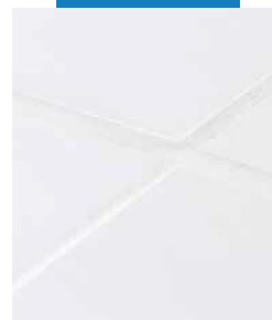
Podlaha vyškárovaná s použitím Kerapoxy Easy Design

4 dni. Povrchy môžu byť vystavené chemickým účinkom po 10 dňoch. Nádrže a plavecké bazény môžu byť naplnené vodou po 10 dňoch. Uvedené časy sú výrazne ovplyvnené teplotou okolitého prostredia.