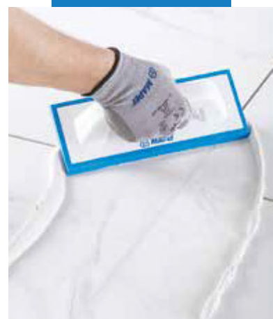
Lahké rozprestretie epoxidovej škárovacej malty