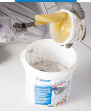
Nalejte tvrdidlo (zložka B) do zložky A