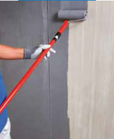
Aplikácia Eco Prim Grip Plus na betón s valčekom