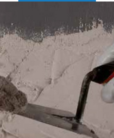
Aplikácia omietky na Eco Prim Grip Plus