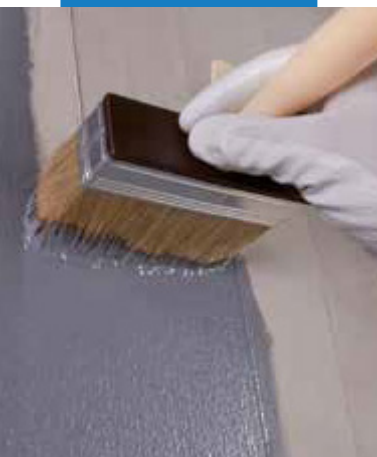
Aplikácia Eco Prim Grip Plus na betón so štetcom