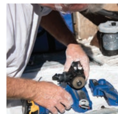
3. Vložte do zariadenia novú pumpu.