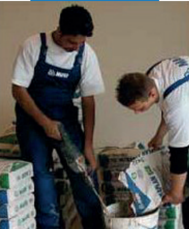
Miešanie Ultraplan Eco – škôlka pre deti - Mirabello – Cantu (Como) – Taliansko