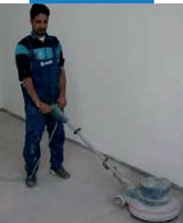
Brúsenie Ultraplan Eco po vytvrdnutí – škôlka pre deti - Mirabello – Cantu (Como) – Taliansko