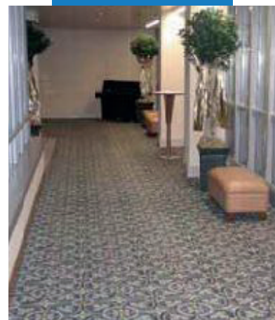
Koberec inštalovaný na Ultraplan Eco v hotelovej chodbe - Hotel Renaissance - Austria