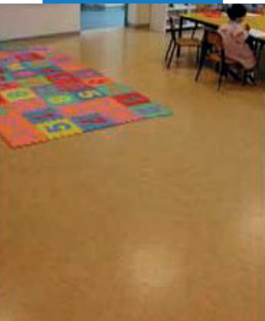
Linoleum inštalované na Ultraplan Eco, ktorý sa použil pri vyhladení cementového poteru

V tomto prípade však najskôr ošetríte povrch penetračným náterom Eco Prim T .