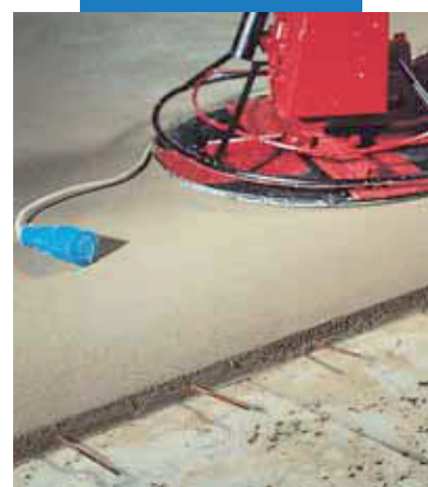
Strojné vyhladzovanie povrchu poteru Topcem