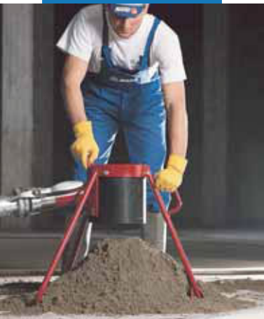
Dávkovanie poteru Topcem.

Topcem , kamenivo a voda sa môže miešať : • v bubnovej miešačke; • v bežnej miešačke na betón; • v závitovej miešačke; • v autodomiešavači; • pomocou automatického tlakového čerpadla. Manuálne miešanie sa neodporúča, pretože nie je zabezpečené rovnomerné rozmiešanie všetkých komponentov so spojivom Topcem . V tomto prípade je potom zvyčajne nutné použitie väčšieho množstva zámesovej vody na dosiahnutie potrebnej konzistencie, čo nepriaznivo vplýva na úbytok vlhkosti a konečnú pevnosť. Tam, kde nie je možné použiť mechanické miešanie, alebo na menšie plochy, pri ktorých sa vyžaduje ručné miešanie, sa odporúča, pred pridaním vody, dôkladne nasucho premiešať Topcem s kamenivom v malom množstve a otáčať zmes, až kým sa nedosiahne konzistencia „vlhkej zeminy“.