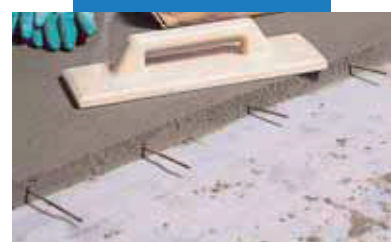
Detail zapracovania výstužnej ocele pri napájaní poteru Topcem