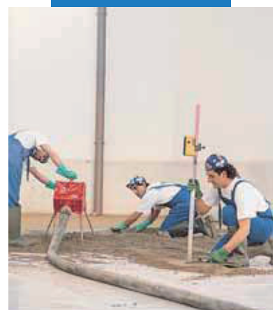
Nanášanie poteru Topcem