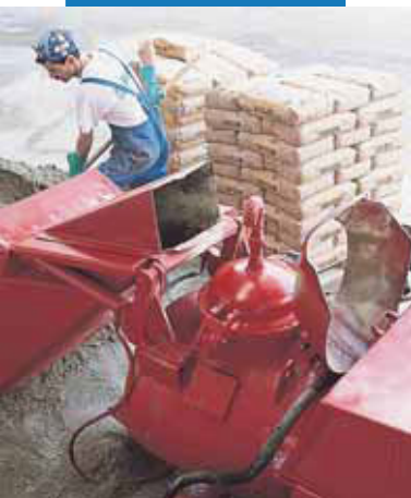
Miešanie poteru Topcem pomocou automatického čerpadla.