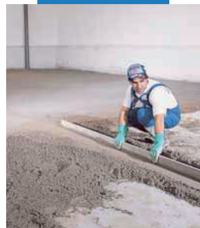
Príprava vodiacich pásov

Topcem nie je rýchlotuhnúce spojivo, preto je čas spracovania porovnateľný s bežnými cementovými potermi.