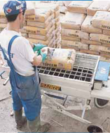
Miešanie poteru Topcem v mini dávkovači.